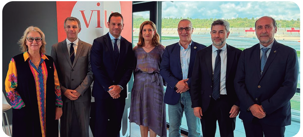
El presidente del CECOVA, tercero por la derecha, en la Jornada Cátedra Motorsport de la VIU.