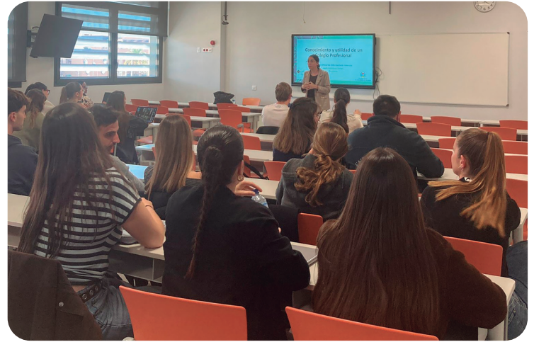
La presidenta del COENV durante su intervención ante las alumnas y alumnos de Enfermería del CEU.

La presidenta también ha incidido en la importancia de la colegiación, señalando que "el Colegio acompaña a los profesionales desde sus primeros pasos, ofreciéndoles apoyo, formación continua y defensa de sus