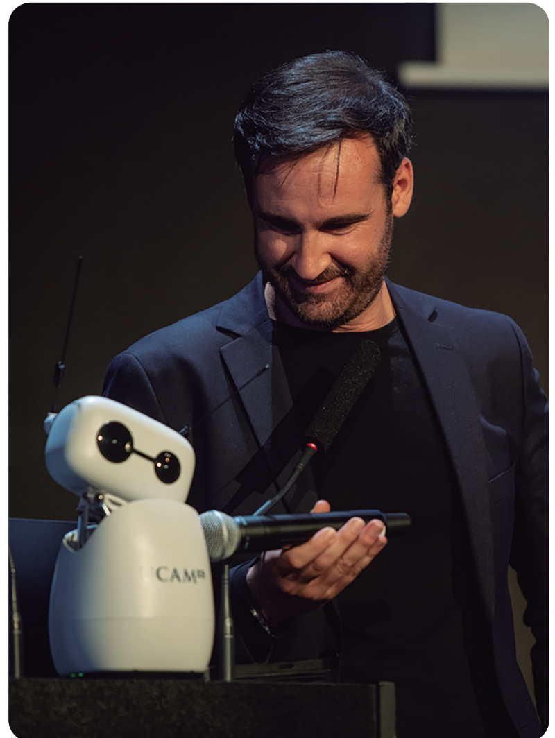
Pau Guardiola, junto al robot humanoide

El Congreso contó con una alta participación de estudiantes de Enfermería, lo que demuestra la cercanía de las actividades organizadas por el Colegio de Enfermería de Alicante a las futuras enfermeras y enfermeros.