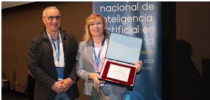
Entrega del reconocimiento al Ayuntamiento de Elche