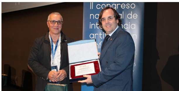
La Universidad CEU-Cardenal Herrera también recibió un reconocimiento

Puedes ver más fotos del congreso en este enlace .