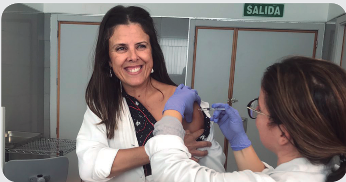
Dando ejemplo: vacunarse de la gripe para atender a embarazadas