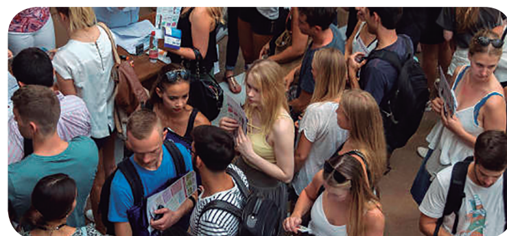
Un grupo de estudiantes en la Universitat de València

Para que resulte más sencillo, cada indicador está presentado en una tabla en la que se compara el resultado de la titulación con respecto a su área académica y al total de la Universitat de València. Los resultados son de utilidad para los centros en los que se han impartido los grados, porque de esta manera cuentan con una base para mejorar sus planes de estudio y aumentar la inserción laboral. Pero no solo para ellos. Tanto los estudian-