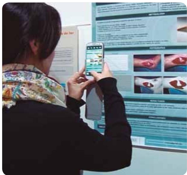
Este año se han realizado muchas jornadas y talleres de formación en prevención de UPP.

EN LA COMUNITAT VALENCIANA EL 6,67% DE PACIENTES HOSPITALIZADOS Y EL 17,24% EN LAS UHD PADECEN ESTE TIPO DE HERIDAS CRÓNICAS