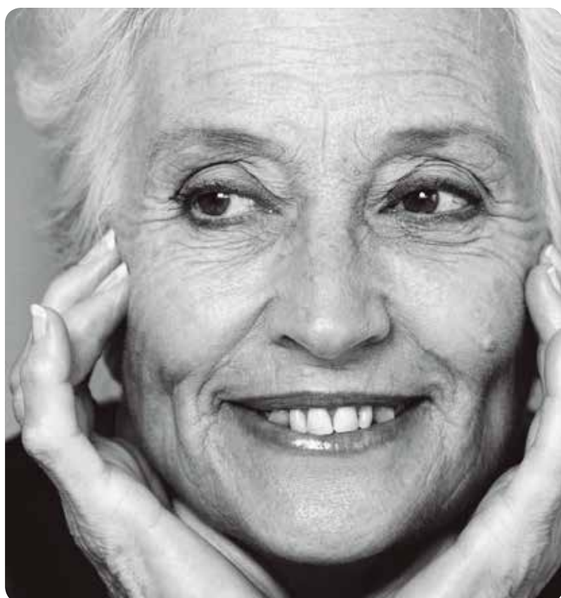
La media de edad de los pacientes atendidos en el SNS supera casi los 54 años.

Por eso el sistema sanitario requiere una "reorientación" para adaptarse al nuevo reto de responder a las necesidades de los pacientes crónicos de forma integral, sobre todo de los casos más complejos o que necesitan atención domiciliaria, donde las enfermeras tienen un importante papel.