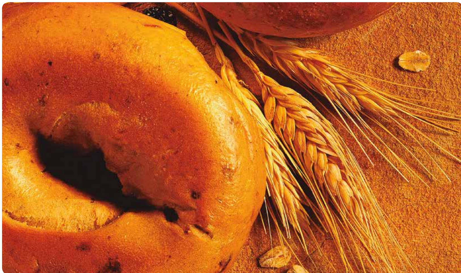
El trigo es uno de los cereales que contiene gluten.

DIRIGIDO A USUARIOS DE LA SANIDAD DE LA COMUNIDAD VALENCIANA