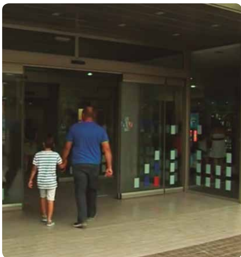
El objetivo del Plan de Vacaciones es cubrir las necesidades asistenciales de la población.

Según la conselleria de Sanitat para cubrir las sustituciones del período vacacional en Primaria y Especializada, se han realizado 7.022 contrataciones: 977 en Castellón, 3.091 en Valencia y 2.954 en Alicante. De ellas, 719 contrataciones han sido de facultativos, 2.312 de enfermeras, 91 de matronas, 98 de fisioterapeutas y 1.692 de auxiliares de enfermería, entre otros.