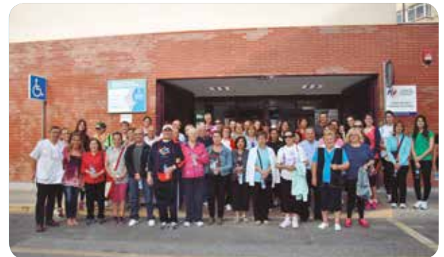
Sexta marcha saludable en apoyo a mujeres con cáncer de mama.

A esta marcha se han unido en esta ocasión otros pacientes y usuarios del centro de salud que han querido de esta forma brindar su apoyo y reconocimiento a este grupo de mujeres por su tesón y valentía y su lucha continua frente a esta enfermedad.