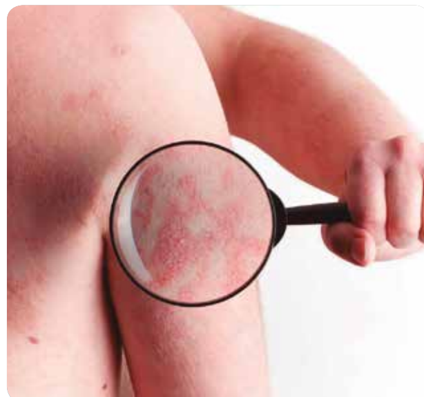
En el día a día surgen numerosas dudas sobre la aplicación de cremas y la hidratación.

Debido a ello, Enfermería se convierte en un apoyo fundamental al explicarles cómo deben realizar estos tratamientos, permitiendo a los médicos centrarse en las consultas.