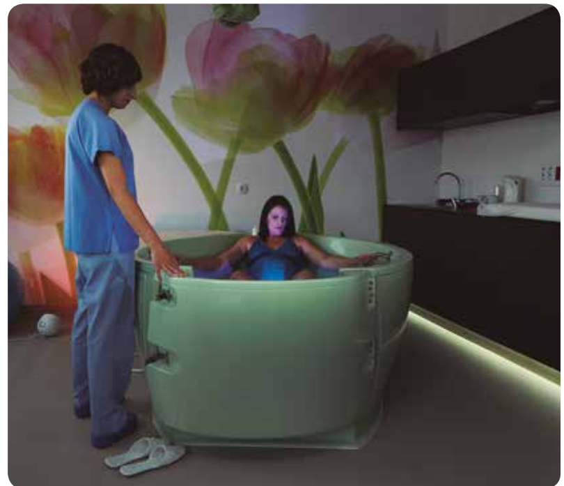
La Casa de Partos cuenta también con una bañera obstétrica para la dilatación en el agua.

La Casa de Partos es la primera área específica de atención al parto natural que se integra en un hospital de la red pública valenciana. Se ha puesto en marcha en el hospital de Manises y está inspirada en los birth center ingleses.