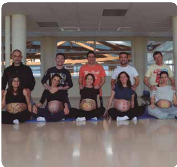
La pintura corporal forma parte del trabajo que se realiza en estas sesiones en pareja.

LA MATRONA DEL CENTRO DE SALUD DE BÉTERA (VALENCIA) GUÍA A LOS GRUPOS DURANTE ESTOS TALLERES DE PREPARACIÓN AL PARTO