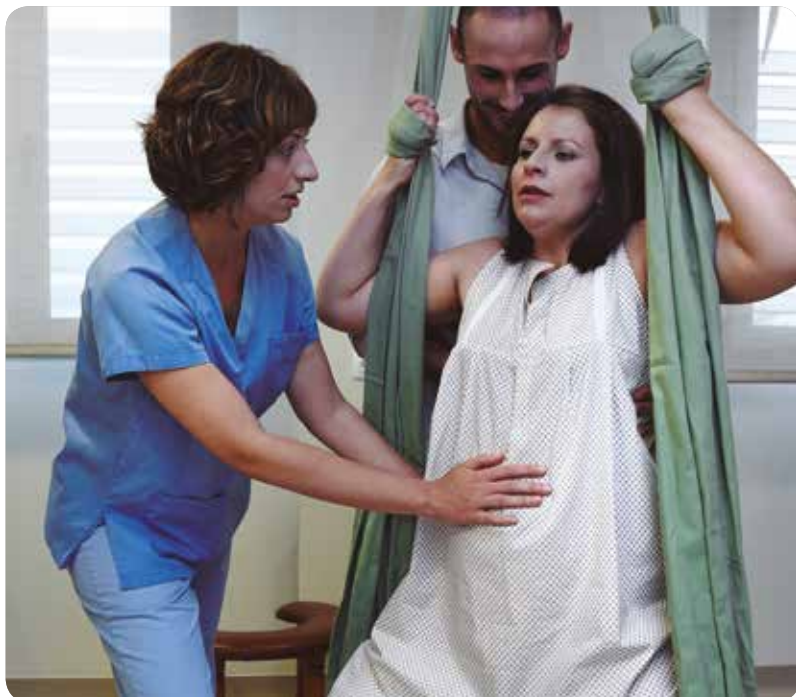
Las mujeres tienen libertad de movimientos gracias a la instalación de distintas herramientas.

ESTE ESPACIO IMITA LA HABITACIÓN DE UNA CASA AL CREAR UN AMBIENTE CÁLIDO EN EL QUE EL EQUIPAMIENTO SANITARIO ESTÁ CAMUFLADO