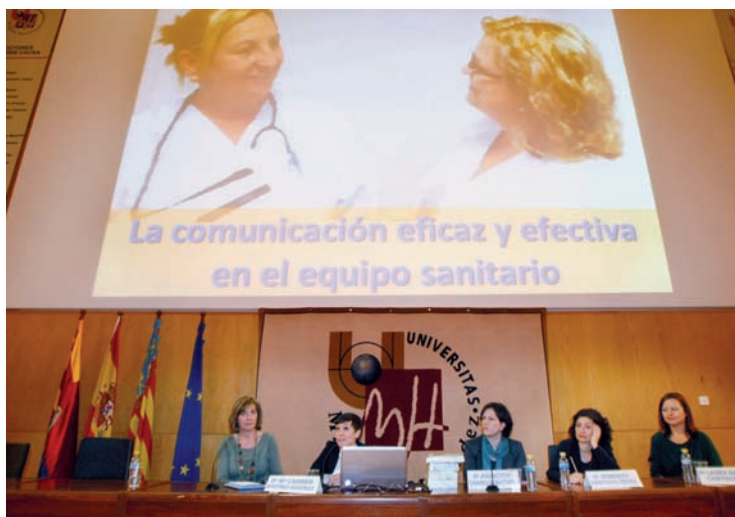
Imagen de una de las mesas redondas