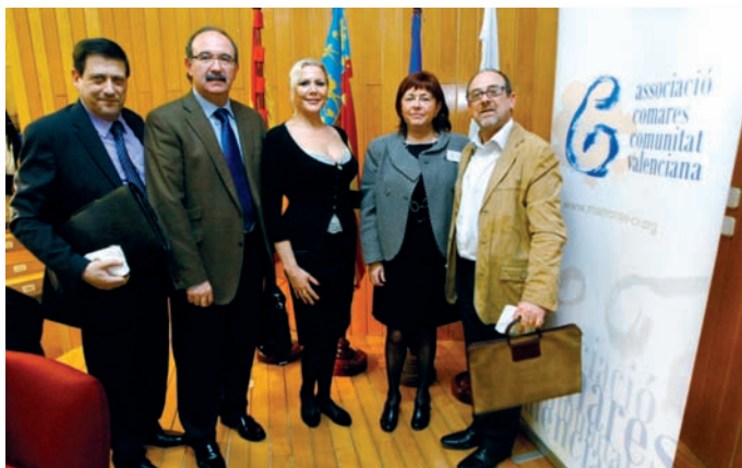
Representantes de las entidades que integran el grupo de trabajo

Este grupo está integrado por la Unidad Docente de Matronas de la Comunidad Valenciana, la Associació de Comares de la Comunitat Valenciana, el sindicato de Enfermería SATSE, CECOVA y los colegios de Enfermería de Alicante, Castellón y Valencia.