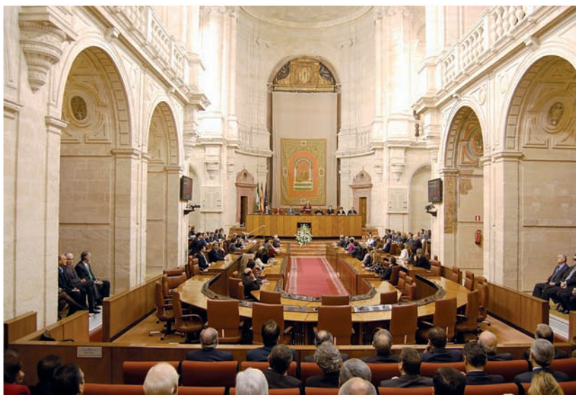
Imagen del Parlamento andaluz

Los frecuentes rumores sobre la posibilidad de que los empleados públicos tuvieran la posibilidad de la libre colegiación han quedado aclarados y descartados con esta sentencia del TC