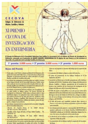
Cartel informativo de la XI edición

Las bases de los premios CECOVA de Investigación en Enfermería, cuyo objetivo es "incentivar el desarrollo y la producción de la actividad científica de Enfermería", establecen que puede optar al mismo cualquier profesional de Enfermería colegiado en la Comunidad Valenciana y que esté al corriente de sus obligaciones colegiales. La participación puede ser a título individual o en grupo y quedan excluidos de la misma los miembros del jurado. El plazo de presentación de trabajos permanecerá abierto hasta 13 de septiembre de 2013.