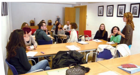
Imagen de uno de los cursos de inglés

La necesidad del conocimiento de idiomas para ampliar horizontes laborales en otros países dada la actual situación económica ha llevado al Colegio de Enfermería de Alicante a poner en marcha una escuela de idiomas a través de la cual se ofrecen cursos de inglés, francés y alemán. Una actividad cuyos primeros cursos comenzaron en enero y se prolongaron hasta abril y que dada la gran aceptación de los mismos ha hecho que se esté trabajando a en una segunda edición de los mismos.