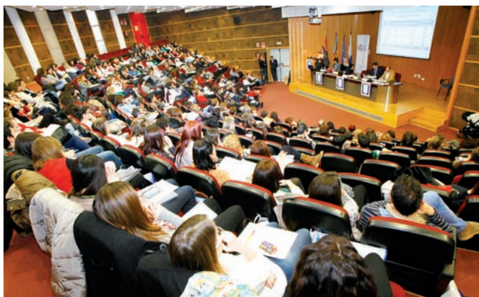
La Jornada congregó a 250 asistentes

La necesidad de la puesta en marcha de este grupo de trabajo viene dada por el elevado número de matronas que en este momento están en paro y para el mejor aprovechamiento de la especialidad para cubrir todos los campos que competen a la misma.