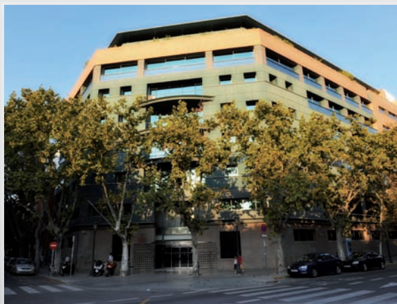
Conselleria de Sanidad