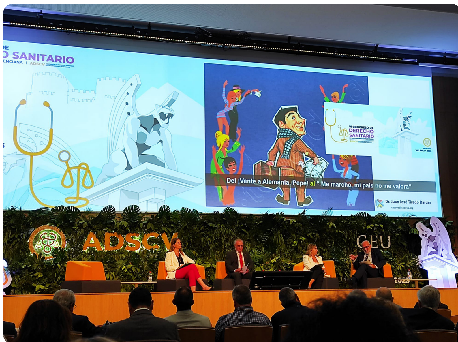
Los integrantes de la mesa redonda: "El Preocupante Éxodo de Nuestro Personal de Enfermería: Motivos y Soluciones".

El presidente del CECOVA destaca esta circunstancia en el VI Congreso de la Asociación de Derecho Sanitario de la Comunidad Valenciana