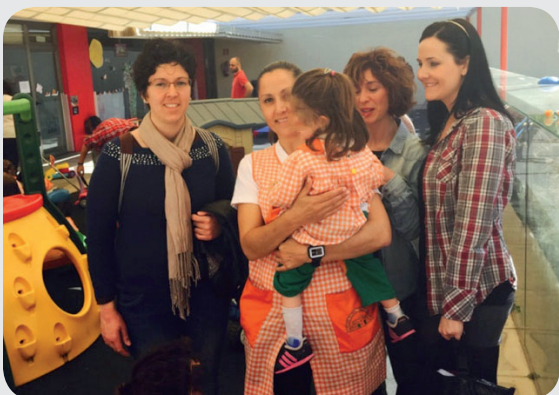
Estudiantes en el centro escolar de L'Alquería

Cinco futuras enfermeras del 3º curso de grado en Enfermería de la Universidad Católica de Valencia (UCV), han realizado una actividad de colaboración con los docentes del Centro de L'Alquería con la finalidad de confeccionar un estudio sobre el conocimiento y la percepción de los docentes ante una crisis de hiperventilación.