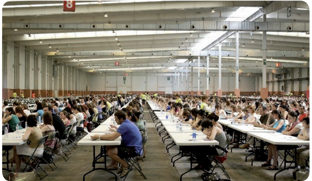
Alumnos realizando la prueba EIR

Otra de las modificaciones que se dará en la próxima convocatoria es que la prueba EIR, prevista para el próximo 2 de febrero de 2016, será más larga, pero también será más rápida de responder. El incremento del número