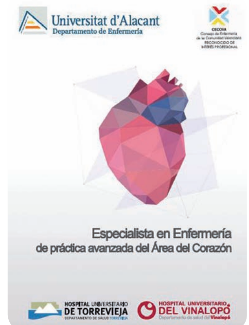
Cartel del curso de Especialista en Enfermería de Práctica Avanzada del Área del Corazón

Además, el alumnado podrá acceder, de forma electrónica, a la documentación de las asignaturas a través del Campus Virtual de la UA.