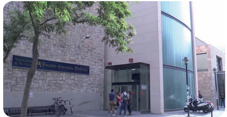
Fachada de la Facultad de Enfermería de la UV

En Alicante, solo 200 nuevos alumnos han iniciado sus clases de Enfermería en la Universidad de Alicante de 1.292 aspirantes.