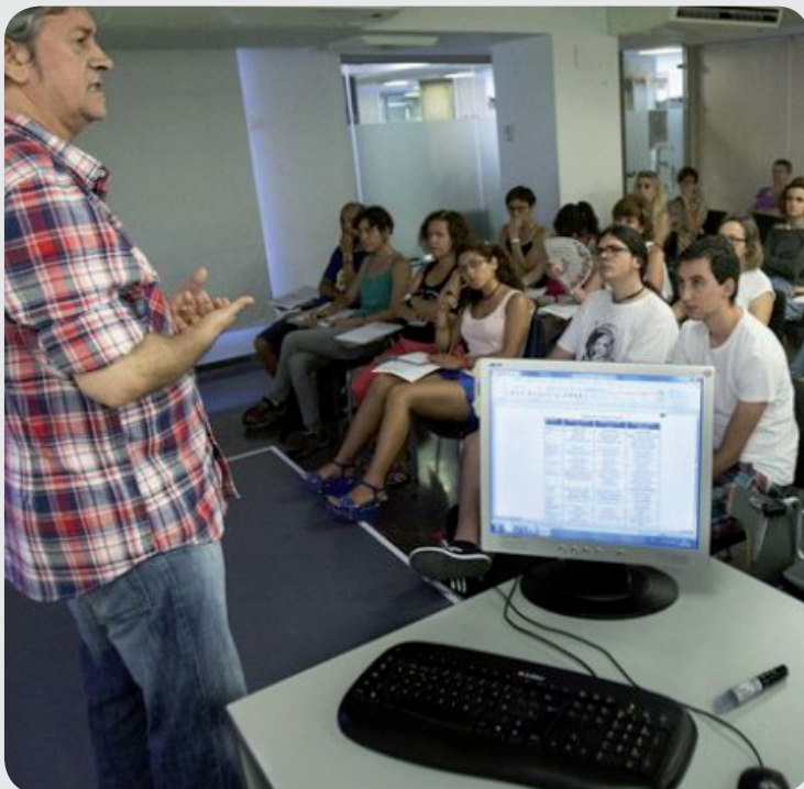
Aulas de la Universitat d'Estiu de Gandía