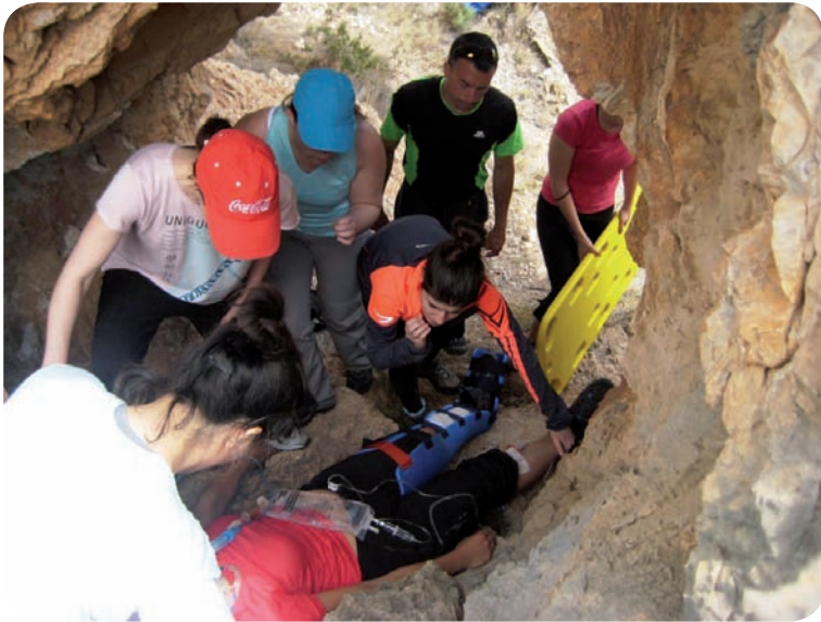
Participantes en taller de atención sanitaria y rescate de montaña celebrado en Finestrat