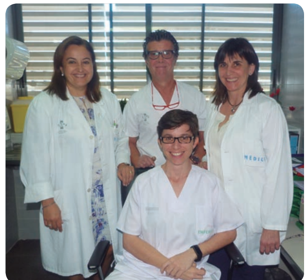
La consulta de Enfermería está integrada en la Unidad de Medicina Digestiva.

Esta consulta de Enfermería está integrada en el Servicio de Medicina Digestiva del Hospital. La unidad se creó en abril de 2016 como servicio de apoyo y seguimiento personalizado a pacientes con EII, que comprende principalmente la enfermedad de Crohn (EC) y la colitis ulcerosa (CU).