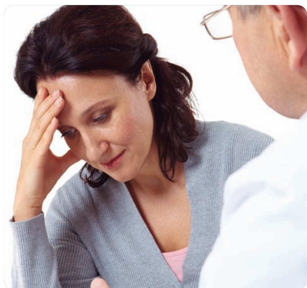
Ansiedad o depresión pueden estar detrás de un caso de violencia de género.

Seis de cada diez mujeres que acudieron a los Centros Mujer 24H interpusieron una denuncia contra su agresor. Así lo evidencian los datos de atención de enero a septiembre, que muestran que 1.650 mujeres fueron atendidas por primera vez en los centros de Valencia, Castellón, Alicante y Denia, junto a 1.263 mujeres que llevaban seguimiento de años anteriores y 295 casos más en los que se han retomado los expedientes que se habían abierto con anterioridad.