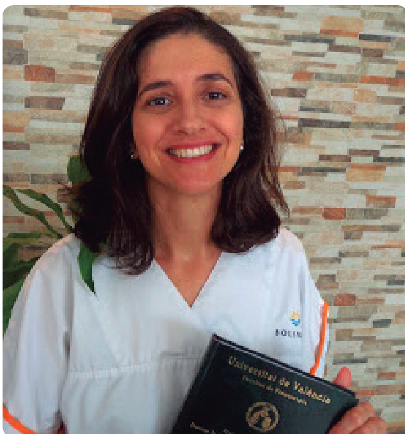
La doctora en Enfermería autora del trabajo sobre sujeciones.

También se aboga por establecer un consenso entre los miembros del equipo profesional antes de aplicar una restricción y elaborar un concepto único de restricciones físicas para las residencias de personas mayores.