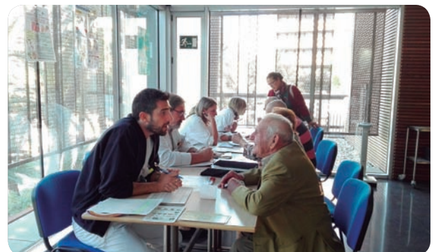
Más de 450 personas han participado en la campaña de información sobre osteoporosis.

Más de 450 personas han participado en la campaña de osteoporosis del Departamento de Salud del Hospital de Elche con motivo del Día Mundial de esta patología. Así, enfermeros expertos han realizado encuestas para detectar factores de riesgo y, en los casos indicados, han incluido a los pacientes en el programa de seguimiento y control con el especialista correspondiente. También se ha impartido educación sanitaria cómo se puede prevenir, además de dar consejos de dieta rica en calcio, vitamina D y proteínas y consejos de hábitos de vida saludable.