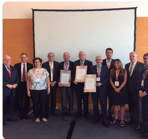
Miembros del equipo de Oncología del HGUV recogen la acreditación QOPI.

El curso abarca los principios generales de la fisiopatología del cáncer, los conceptos básicos en Oncología Molecular e Inmunología, la toxicidad de la quimioterapia, la investigación en el cáncer, el control de síntomas en la consulta de Enfermería y diferentes tipos de cáncer.