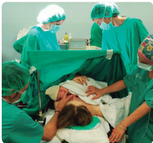
El protocolo incluye el contacto piel con piel.

EL PROTOCOLO DE ACOMPAÑAMIENTO INCLUYE LAS PAUTAS PARA REALIZAR EL CONTACTO PIEL CON PIEL Y EL INICIO DE LA LACTANCIA EN EL PARITORIO