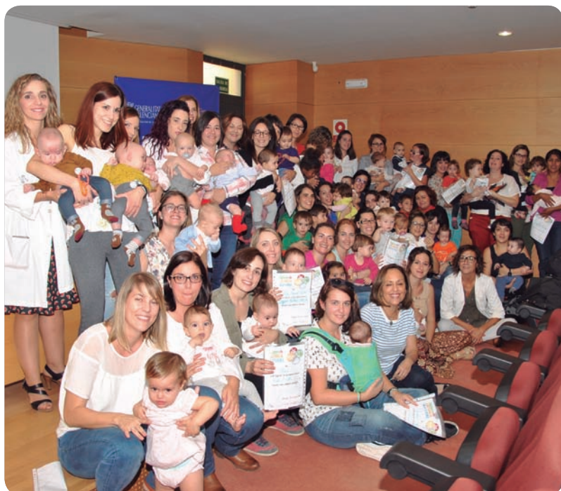
La Plana ha celebrado la IV Fiesta de la lactancia materna.

LA LACTANCIA MATERNA TIENE BENEFICIOS PARA EL SISTEMA INMUNOLÓGICO DEL BEBÉ Y SU SALUD A LARGO PLAZO, TAMBIÉN PARA LA SALUD DE LA MADRE