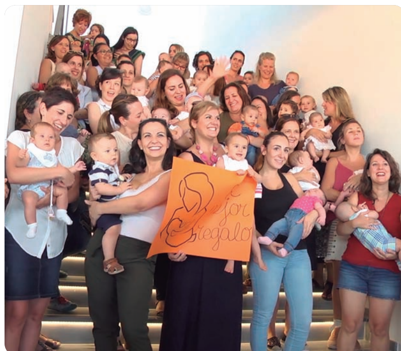
La jornada sobre lactancia materna de Denia comenzó con una foto de familia..

La lactancia materna reduce la mortalidad infantil y tiene beneficios para la salud a corto pero también a largo plazo. En octubre se conmemora en Europa la Semana Mundial de la Lactancia Materna y han sido muchas las actividades que se han realizado en los departamentos de salud de la Comunitat Valenciana para promover y apoyar la lactancia materna.