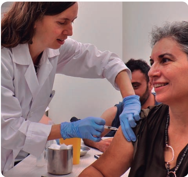
Los profesionales sanitarios también están entre los grupos de riesgo.

CECOVA ORGANIZA UNA JORNADA EN LA QUE EXPERTOS EN SALUD PÚBLICA Y VACUNACIONES EXPLICAN LA IMPORTANCIA DE ESTAR VACUNADOS