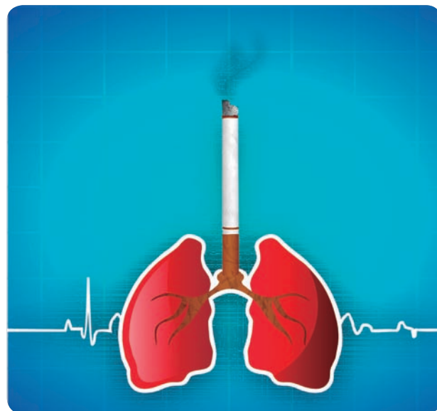
El tabaco es la principal causa de la EPOC.

En la Comunitat Valenciana se estima que el 9% de la población valenciana entre 40 y 60 años padece esta alteración pulmonar obstructiva crónica.