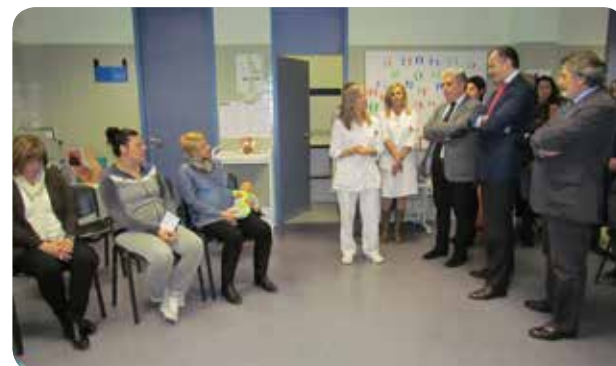
El conseller durante la visita al centro de salud de Moncada.

En este mismo centro se encuentra también la Unidad de Tele-úlceras del departamento Arnau de Vilanova-Llíria. El proyecto, ejecutado por los profesionales de Atención Primaria, tiene como objetivo mejorar la prevención y la eficacia de los cuidados de estas lesiones dermatológicas. Desde que se pusiera en marcha en 2010 se han remitido a esta Unidad 278 casos desde los diferentes centros de atención primaria.