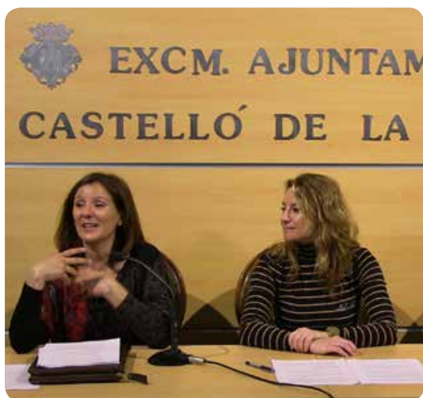
Presentación de las campañas de promoción de la salud.

EL OBJETIVO DE ESTAS INICIATIVAS ES FOMENTAR LA EDUCACIÓN EN HÁBITOS SALUDABLES, COMO LA ALIMENTACIÓN DESDE LA INFANCIA