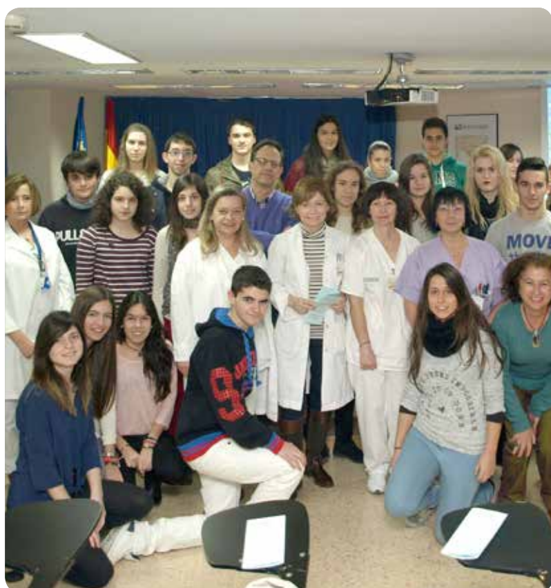
Foto de uno de los grupos que participó en las jornadas de puertas abiertas.

En esta iniciativa que ha tenido gran éxito, una vez más, han participado más de 200 alumnos de secundaria de los centros docentes IES Penyagolosa, Colegio Madre Vedruna-Carmelitas, IES Politécnic, IES Joan Baptista Porcar, IES Matilde Salvador, Colegio San Cristóbal, IES Caminàs, IES Violant de Casalduch, IES La Plana, Colegio Mater Dei, IES Sos Baynat, Agora Lledó Internacional School.