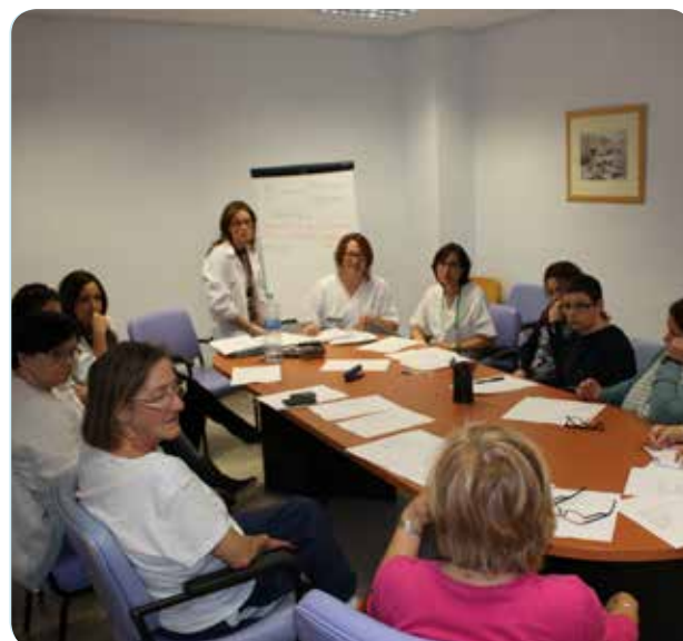
Uno de los primeros talleres que se han realizado.

Este síndrome se caracteriza por un agotamiento físico y psíquico del cuidador, provocado por un estrés continuado. Los problemas físicos del Síndrome del Cuidador son osteomusculares, cardiovasculares, gastrointestinales, respiratorios e inmunológicos.