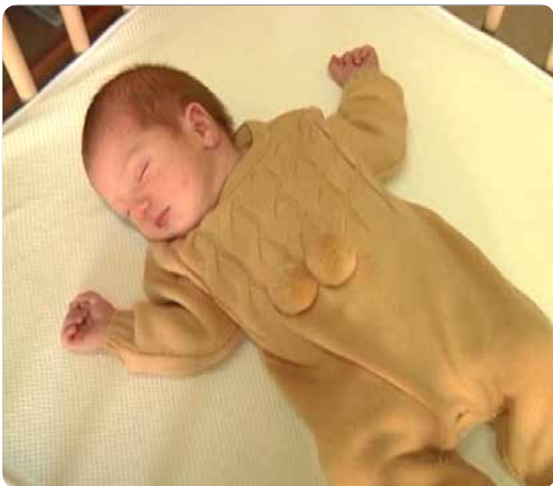
Dormir boca arriba es una de las recomendaciones de los profesionales sanitarios.

EN LAS CLASES DE PREPARACIÓN AL PARTO LAS MATRONAS EXPLICAN LA INCIDENCIA DE ESTE SÍNDROME Y CÓMO DEBE DORMIR EL BEBÉ