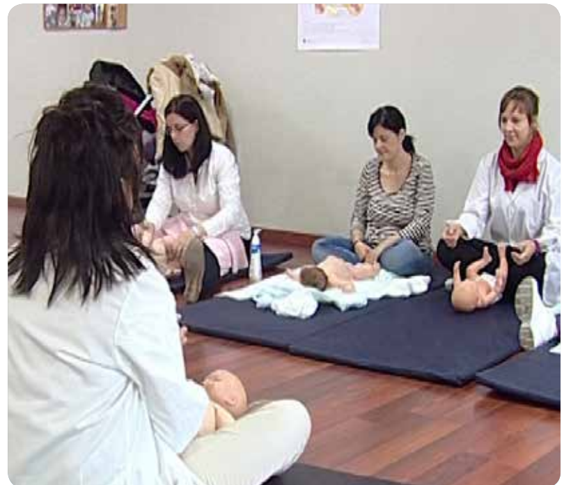
Las matronas explican en los cursos la incidencia de la muerte súbita y cómo prevenirla.

La muerte súbita es la muerte sobrevenida en niños sanos mayores de un mes y menores de un año que se produce durante el sueño. Es la principal causa de muerte inexplicable durante el primer año de vida, sobre todo en los seis primeros meses cuando tienen lugar hasta el 85% de los casos, pero esto representa solo un pequeño porcentaje, aunque con unos devastadores efectos en las familias que lo sufren.