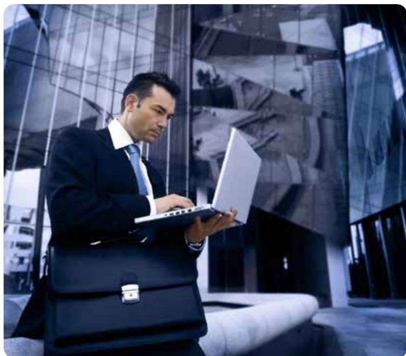
El estrés es uno de los factores de riesgo cardiovascular.

ESTE TIPO DE ENFERMEDADES SON LA SEGUNDA CAUSA DE MUERTE EN ACCIDENTE LABORAL Y PRODUCEN UNAS 23.000 BAJAS AL AÑO