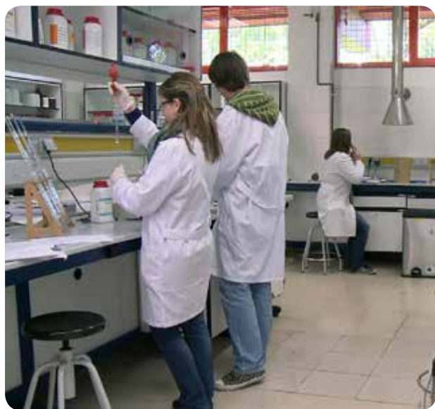
La prevención de los riesgos biológicos es fundamental para la seguridad de los pacientes.

ENFERMERAS DEL HOSPITAL DE ALCOY, EN ALICANTE, PARTICIPAN EN UN PROGRAMA DIRIGIDO A MEJORAR LOS SISTEMAS DE SEGURIDAD