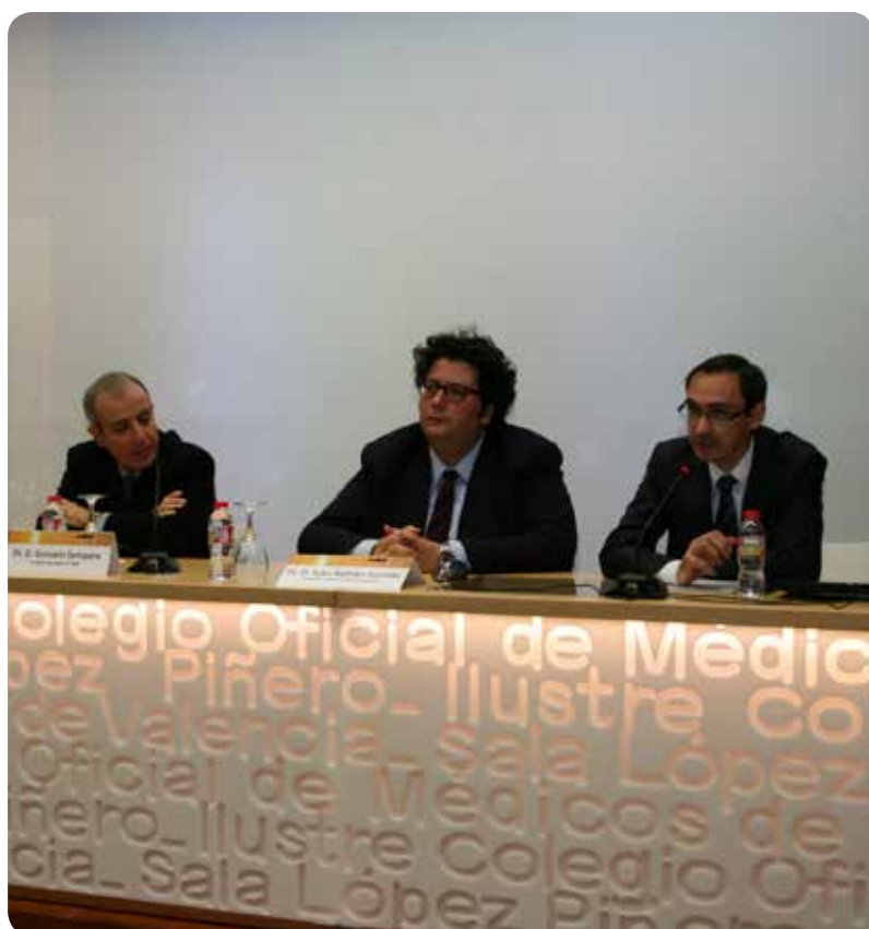
Inauguración de las III Jornadas de Unidades de Corta Estancia de la Comunitat.

En la Comunitat, las UCE se crean en 1995 para trabajar coordinadamente con las UHD y los hospitales sociosanitarios. Las más recientes han sido las de los hospitales de Ontinyent y Marina Baixa.