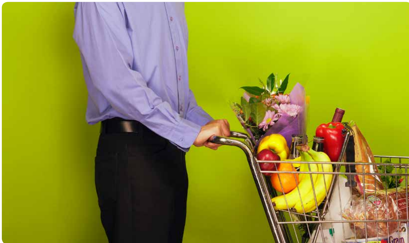
La dieta mediterránea es un buena aliado para empezar a seguir un estilo de vida saludable.

DIRIGIDO A USUARIOS DE LA SANIDAD DE LA COMUNIDAD VALENCIANA