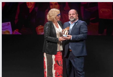
Premio en la Gala de la Salud

Asimismo, la Unión Profesional Sanitaria de Alicante (UPSANA), integrada por once colegios profesionales del ámbito sanitario de la provincia, celebró en