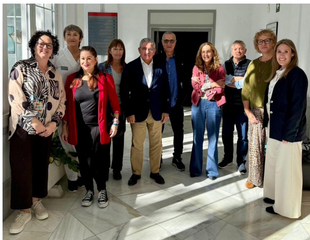
Imagen de los asistentes a la reunión.

El CECOVA ha manifestado que el documento constituye un sólido argumentario científico, clínico y económico que justifica