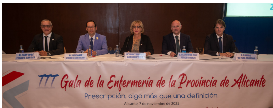
Imagen de la mesa presidencial.

El presidente del CIE pronunció la conferencia sobre el lema de esta edición