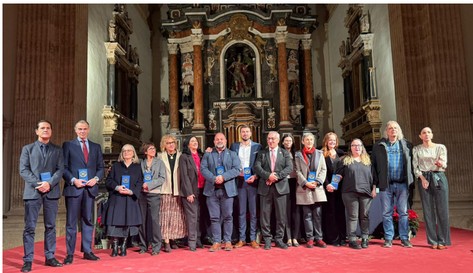
Fotografía de grupo de los premiados y miembros de la mesa presidencial.

El Consejo de Enfermería de la Comunidad Valenciana (CECOVA) ha celebrado la tercera edición del Día de la Enfermería en el emblemático monasterio de San Miguel de los Reyes, una jornada que ha reunido a repre-