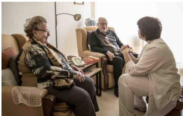
Imagen de una residencia de personas mayores

a la prestación de cuidados de Enfermería, tales como administración de medicamentos, curas, sondajes, etc. Se ha requerido a la Dirección Territorial de la Conselleria de Servicios Sociales, Igualdad y Vivienda a que proceda a la mayor brevedad a restituir, como venía siendo antes del pasado día 28 de octubre, la presencia de enfermeras y enfermeros en el turno de noche en la residencia.