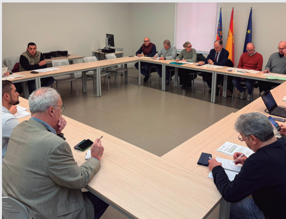
La Conselleria de Emergencias e Interior se ha reunido con los diferentes colectivos implicados en los bous al carrer (Fotografía: GVA).

Uno de los temas más relevantes abordados durante este encuentro ha sido el seguimiento del proceso administrativo que está llevando el nuevo Reglamento de Festejos